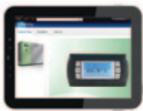
usa la grafica personalizzata