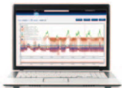
accedi alle variabili in tempo reale