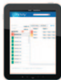
controlla lo stato del tuo impianto

Puoi liberamente scegliere quale tipo di connettività utilizzare tra il canale wireless GSM o la linea Ethernet, con soluzioni sicure ed affidabili. Puoi quindi accedere a tutte le informazioni del sito attraverso qualsiasi dispositivo abbia a disposizione: dal tuo PC se sei in ufficio o dallo smartphone o tablet ovunque il tuo lavoro ti porti.