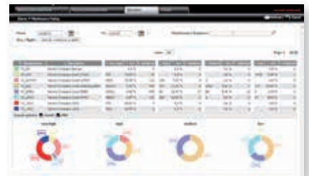
Calidad del servicio