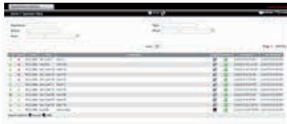
Sinóptico de supervisores