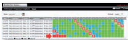
Análisis de temperatura de mostradores frigoríficos