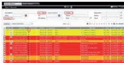
Gestión de alarmas

Optimización de las instalaciones, ahorro energético y calidad del producto son los objetivos principales de la solución de centralización de datos: