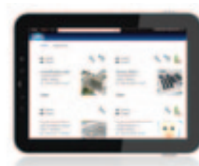
controlla lo stato del tuo impianto

La connettività al tuo impianto è semplice e immediata e puoi liberamente scegliere quale tipo di connettività utilizzare tra il canale wireless GSM o la linea Ethernet, con soluzioni sicure ed affidabili. Puoi quindi accedere a tutte le informazioni del sito attraverso qualsiasi dispositivo tu abbia a disposizione: dal tuo PC se sei in ufficio o dallo smartphone o tablet ovunque il tuo lavoro ti porti.