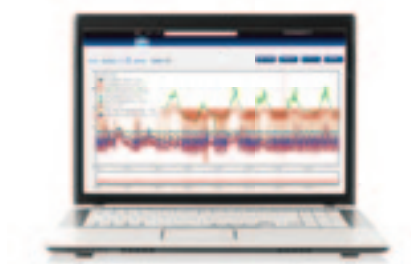
analizza il comportamento del sito

Anticipa l'intervento di riparazione prima ancora che il cliente si accorga del problema, grazie all'analisi dati combinata con la notifica degli allarmi.